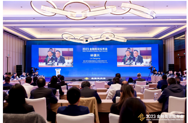
图：活动现场氛围浓烈

势，更加凸显其专业性、权威性、国际性，展现了极高的水平和深度。林德兴先生从雅仕维传媒的经营经验、户外广告的传播使命、结合香港发展的优势等，与出席嘉宾进行精彩分享。