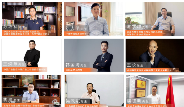
图：部分伙伴祝福展示

同时透过线上多媒体渠道，并借助视频号邀请行业协会领导、行业同仁、知名企业代表、员工代表等 100+ 参与 30 周年视频录制共庆活动，汇聚一众行业内外大咖共同见证公司的成长和发展，开启新征程，构建新篇章。雅仕维传媒创始人、董事会主席林德兴先生站在新起点，与时俱进迎接新机遇、应对新挑战，以强烈的企业责任感和勇于担当的精神