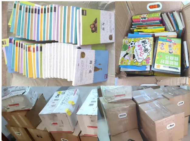
图：基金会为爱心图书室补充书籍

领域共计近 2000 册书籍。希望这些书籍能够丰富学生们的内心世界，营造更好的学习氛围。近年来基金会的公益力量受到越来越多的社会关注，今年联动学乐 Scholastic 出版社捐赠近千本原版英文图书绘本及各种读物，为学生补充外文绘本，进一步拓展学生们的视野。林君瑾慈善基金会也将传递这份爱心，帮助更多青少年培养阅读习惯，传递积极向上的正能量。