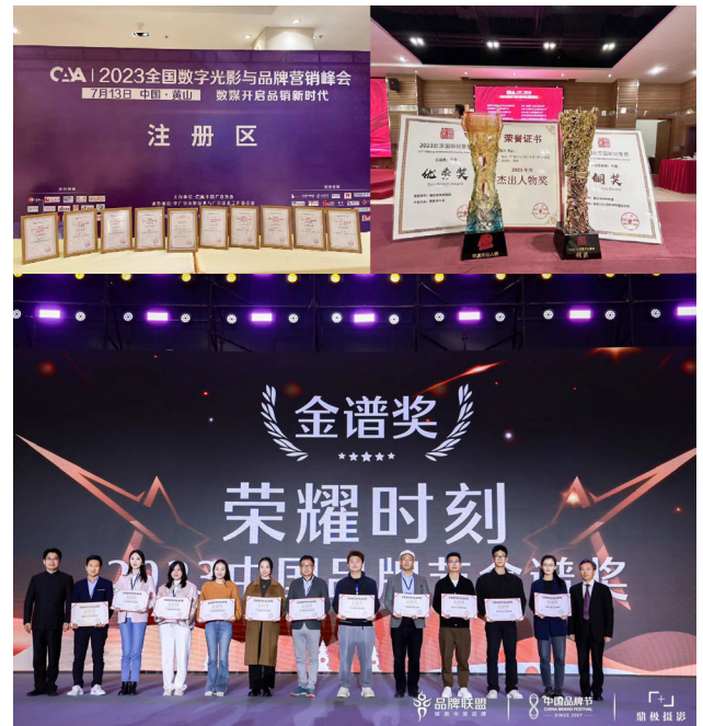
图：砥砺前行共创佳绩

在市场竞争激烈的环境下，雅仕维传媒持续探索户外广告数字化发展方向，始终保持敏锐的市场洞察能力和创新精神，积极拥抱创新，不断拓展新的业务领域和市场空间，提高企业的核心竞争力。今年在中国国际广告节、IAI 传鉴国际创意节、北京国际创意节等多个行业活动中，斩获包括 8 个金奖在内的近 70 项荣誉，同时加强与客户紧密联系，助力 9 个品牌客户在重大行业活动中脱颖而出荣获品牌大奖，不断提升服务质量和客户体验，携手客户共创户外广告创意发展。这些奖项荣誉不仅是对雅仕维传媒发布创意广告的鼓励和认可，也推动着户外广告行业的发展与进步。