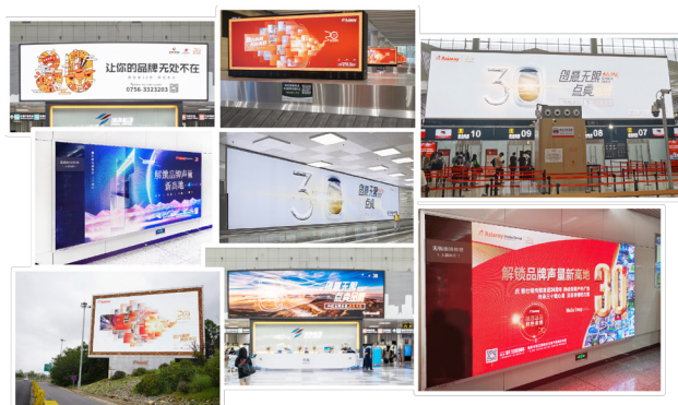
图：全国各地媒体闪亮发布

风雨兼程三十年，雅仕维传媒见证并参与了户外广告行业的发展，今年也本着绿色高效及线上线下联动的原则，发起了贯穿全年的庆祝活动，围绕“三十而‘励’ 奋进新征程”主题，从三十周年 logo 设计到联合 FTI 全球数字艺术创意大赛，面向社会大众及雅仕维员工发起征集，收到众多平面及视频作品，最终选出三十周年 logo 及 8 幅优秀招商设计作品，在雅仕维传媒全国的优选媒体闪亮发布，传递集团蓬勃向上、勇毅前行的精神风貌！