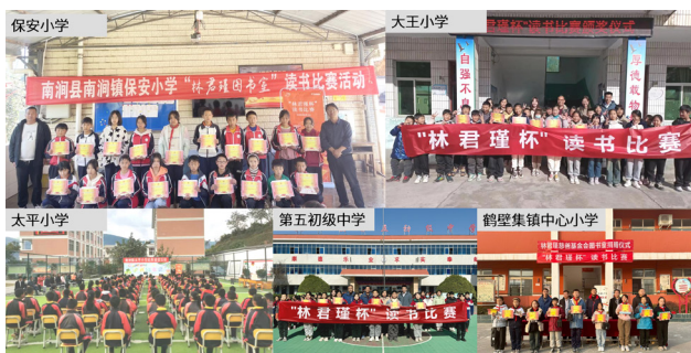
图：读书比赛颁奖现场

林君瑾慈善基金会成立至今，一直致力于关注留守儿童的身心健康，每年一度的读书比赛更是鼓励学生多读书、读好书的重要活动。今年举办的第六届林君瑾杯读书比赛以“幸福”为话题，收到 103 篇参赛作品，学生们通过阅读并结合实际生活，分享自己的幸福时光，字里行间透着浓浓的暖意，在丰富校园文化生活的同时也更懂得珍惜生活。未来，雅仕维传媒也将继续践行“仁爱”文化，深耕公益，为教育工作贡献企业力量。