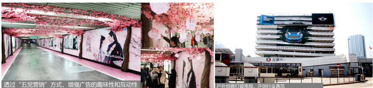
图片三：雅仕维传媒创新空间管理案例获哈佛大学商学院收录，包括其结合技术和创意刺激人类的五觉的电视剧推广活动，及将停车场的外观纳入设计之中的3D插图广告牌。